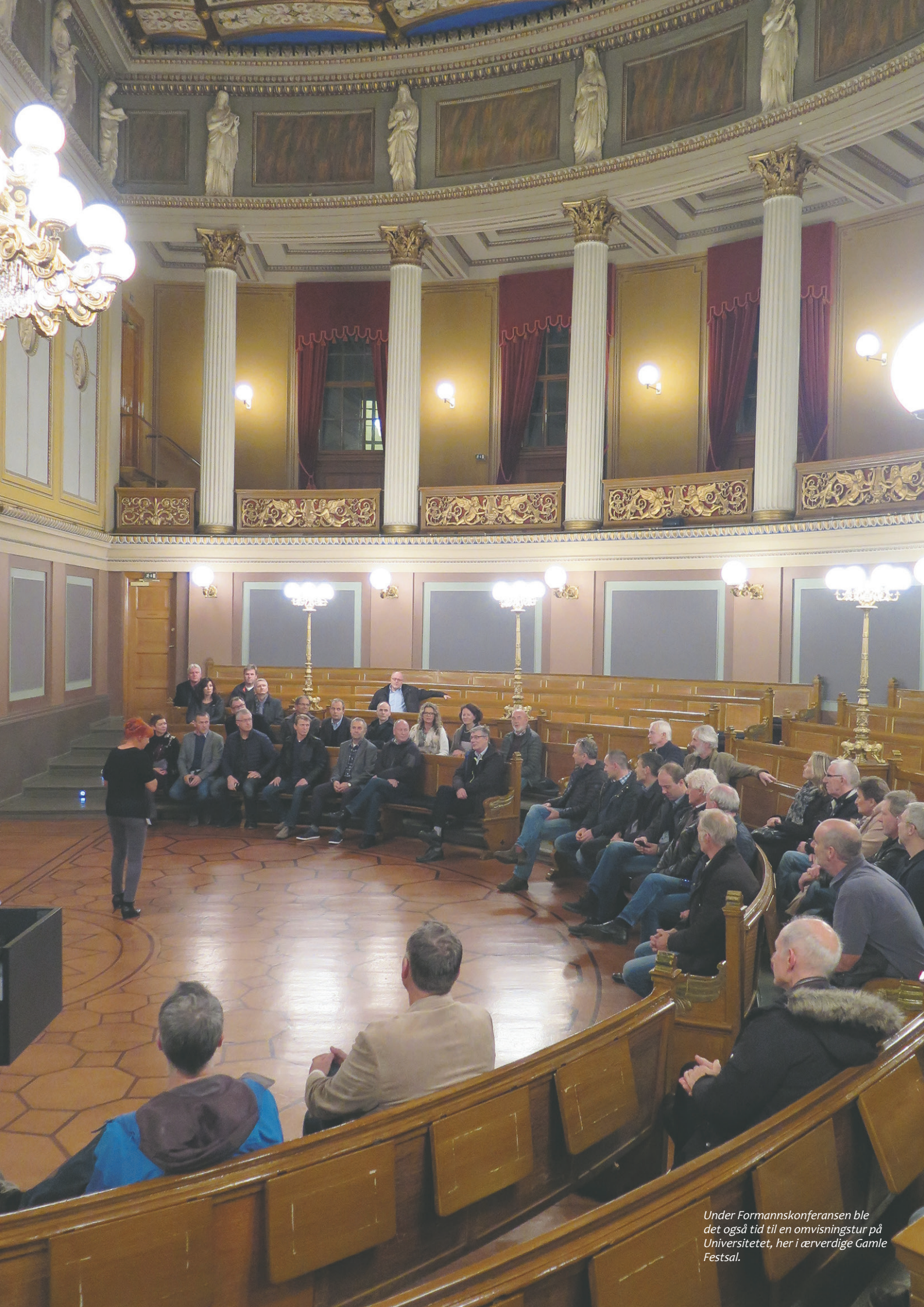
Under Formannskonferansen ble det også tid til en omvisningstur på Universitetet, her i ærverdige Gamle Festsal.