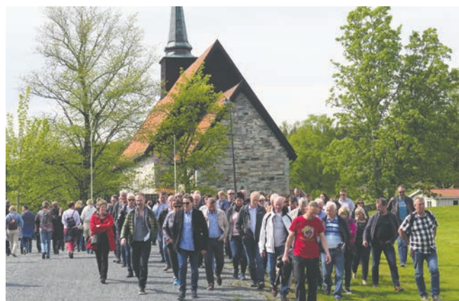
Omvisning på Stiklestad.