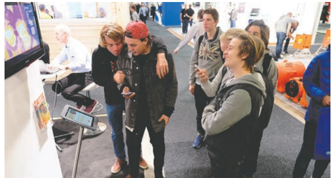
Moro med termografikamera på standen!

Fredag var seminaret rettet inn mot de utførende (Håndverk- og entreprenørdagen), med fokus på lærlinger,