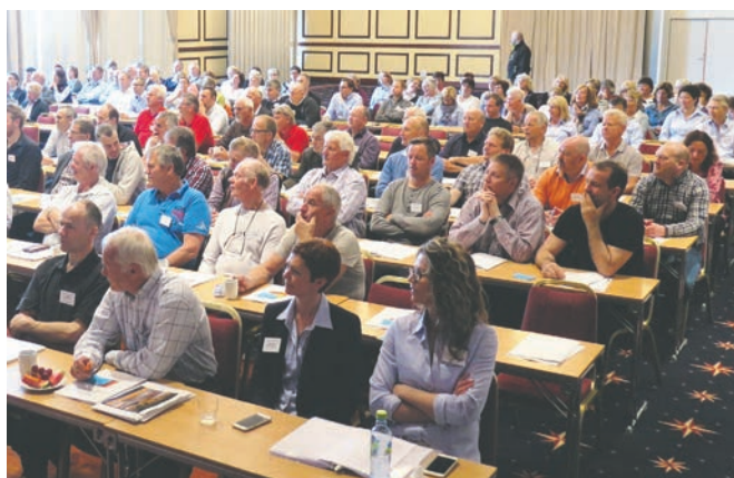
Full sal under åpningen av landsmøtet.