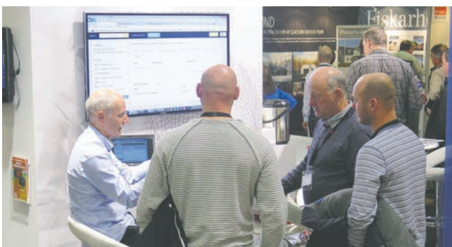
Godt besøk på vår stand og stor interesse for KS Online og KalkOnline som ble lansert under Bygg Reis Deg.