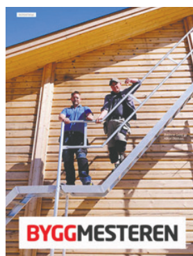
Byggmesteren som e-blad ble lansert på Bygg Reis Deg i oktober.

Byggforlaget AS gir ut fagtidsskriftet Byggmesteren og nettstedet www.byggmesteren.as . Byggmesterforbundet eier alle selskapets aksjer. Byggmesteren har stor tillit og en sterk posisjon som nisjeblad for tømmerfaget i byggenæringen. Nyhetsbrev som sendes ut pr. e-post to ganger ukentlig, blir godt mottatt. En stor andel av abonnentene på denne tjenesten er medlemmer i forbundet.