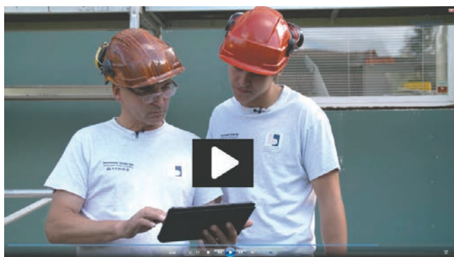
På www.ksonline.no kan du se film som viser systemet i bruk ute på byggeplass.

I mange år har Byggmesterforbundet gjennom sitt engasjement i Bygg og Bolig AS tilbudt styringssystem til medlemmene gjennom det nettbaserte dataprogrammet Bygg og Bolig Styringssystem. Som følge av ønsker fra medlemmene og bransjen for øvrig, teknologisk utvikling og etter hvert ulikt engasjement hos de tre eierne, valgte Byggmesterforbundet i 2014 å starte arbeidet med å utvikle et eget KS-system. Høsten 2015 lanserte Byggmesterforbundet sitt nye system under navnet KS Online.