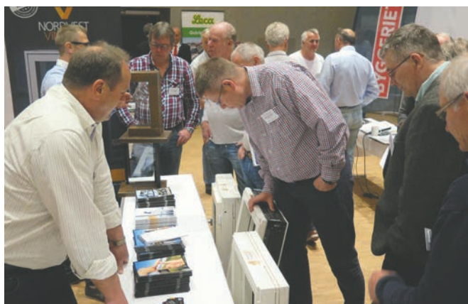
Mye nyttig å få med seg på leverandørmessa.