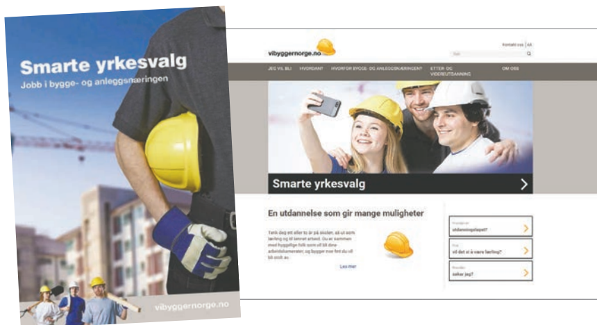
BNL har relansert nettsiden vibygger norge.no og laget ny rekrutteringsbrosjyre for bygg- og anleggsgfagene.