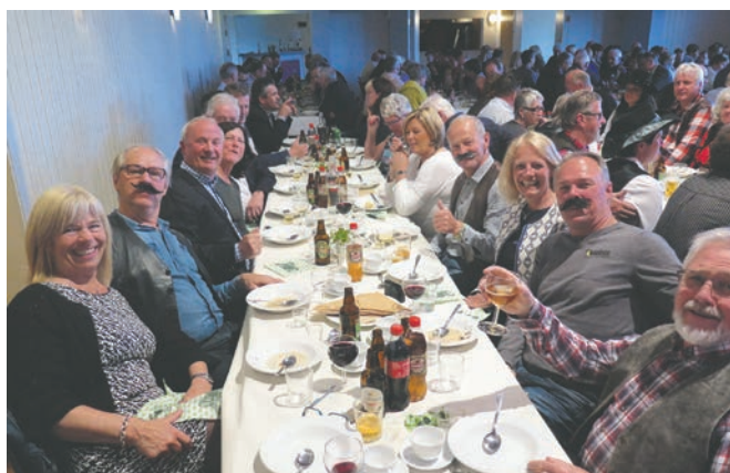
Det ble registrert høy barte- og skinnvestfaktor på Vømmølfesten fredag.