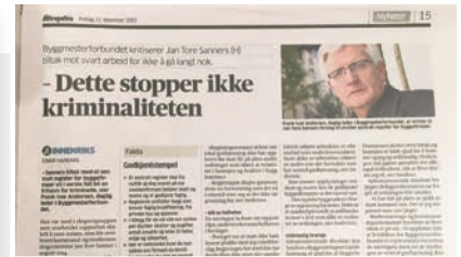
Aftenposten 11. des. 2015. Om ny sentral godkjenning og nye byggeregler.