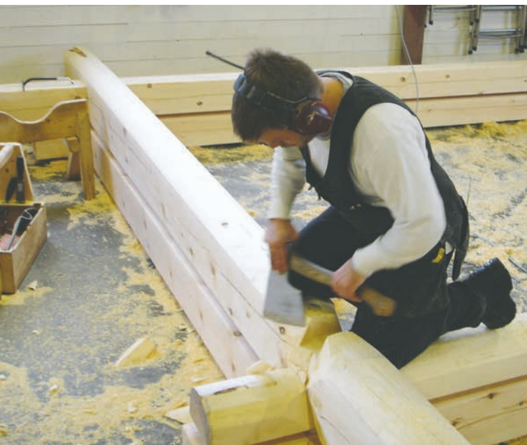
Etter protester fra Byggmesterforbundet og andre i næringen ble laftede bygg unntatt fra de nye energikravene.

knyttet til produksjon for å bygge er omlag tilsvarende klimagassutslippet fra energibruken i hele byggets levetid. Energimålene må derfor gjelde for hele byggets livsløp (produksjon, materialvalg, transport og destruksjon).