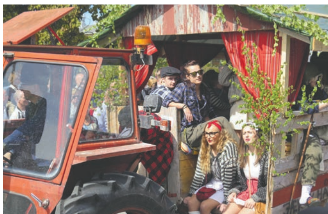
Mye artig å se på i Vømmøltoget på Verdal!