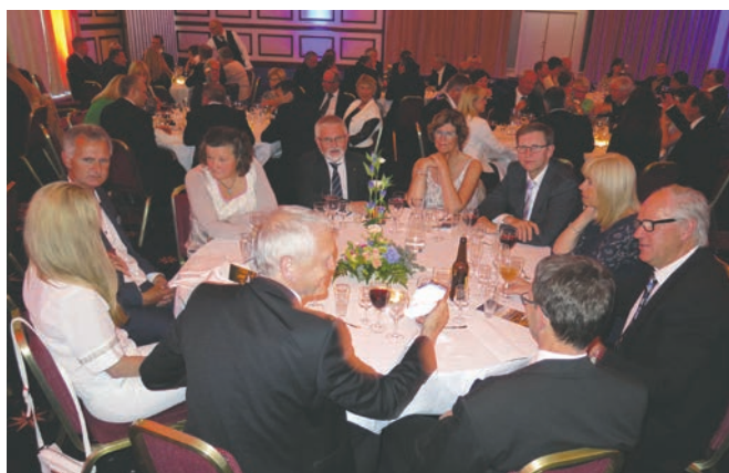
Landsmøtet ble, tradisjonen tro, avsluttet med festmiddag lørdag kveld.